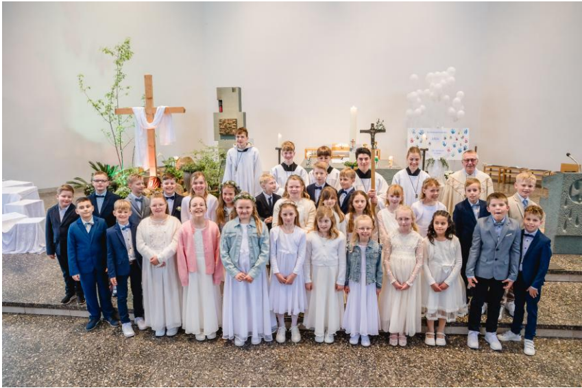
St. Johannes Spelle