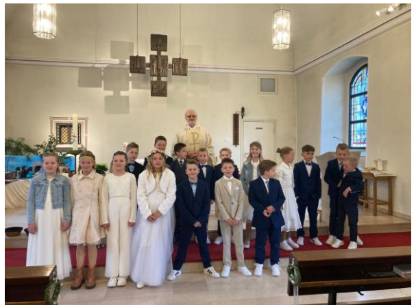
St. Vitus Venhaus