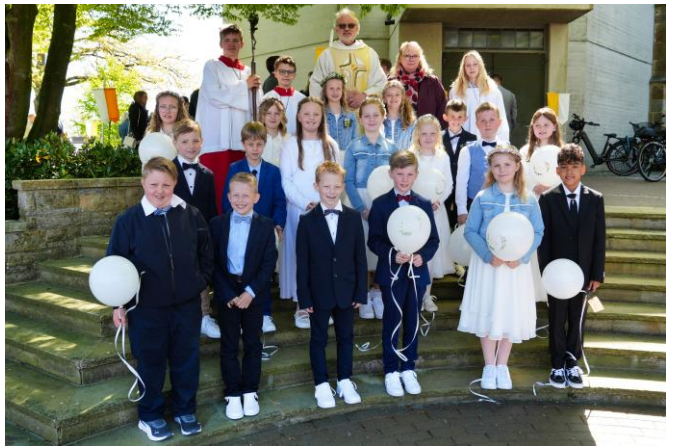
St. Vitus Lünne