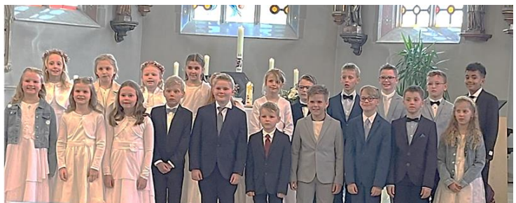
Kommunionkinder St. Vitus Lünne