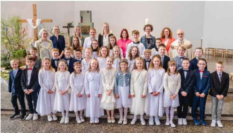
Kommunionkinder St. Johannes Spelle