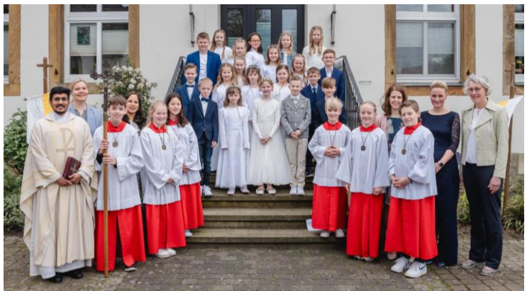
Kommunionkinder St. Vitus Venhaus