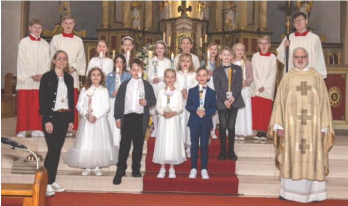
Kommunionkinder St. Ludgerus Schapen